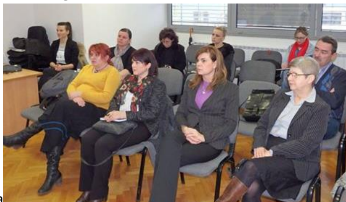
Kutini u prostoru LAG- a Moslavina